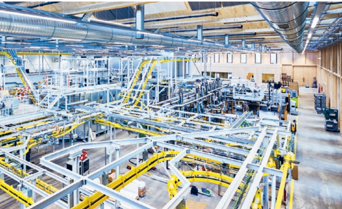
Garraumschweissanlage und Produktionsanlagen der neuen Oberflächentechnik Emaillieren im Zephyr Hangar

Der Standardausbau der neuen Kühlschrankfabrik in Sulgen mit über 21'000m 2 Geschossfläche konnte abgeschlossen werden. Seit Herbst 2020 läuft die stufenweise Übergabe an den Betrieb mit den umfangreichen Betriebsausbauten und -installationen. Mit dem Einbau der Messkammern und der Einbringung des Regalbediengerätes im Hochregallager wurden bereits wichtige Meilensteine der Produktionsverlagerung von Arbon nach Sulgen erreicht. Die vollständige Betriebsaufnahme erfolgt Anfang 2022.