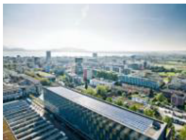
Foto 1 V-ZUG investe sulla Svizzera come sede produttiva, dal 1913 e anche in futuro