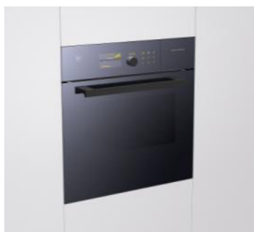
Foto 3 L'alta qualità degli apparecchi di V-ZUG deriva dal connubio di diversi fattori: tra cui la lunga durata utile dei prodotti