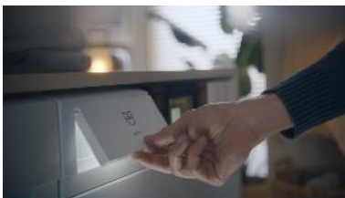
foto 2 La nuova campagna pubblicitaria di V-ZUG mette in risalto queste eccezionali funzionalità presentandole in modo moderno in diversi formati