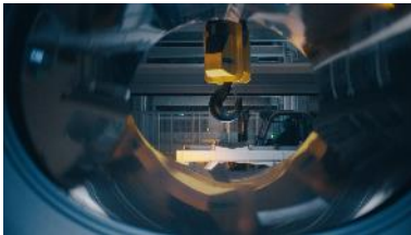
foto 1 Sono i dettagli a fare la differenza – dallo sviluppo, alla produzione fino all'utilizzo del dispositivo a casa del cliente