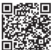
Geschäfts- und Finanzbericht www.vzug.com/ch/de/financial-reports

Die V-ZUG Holding AG bearbeitet personenbezogene Daten unter Einhaltung ihrer Datenschutzerklärung, verfügbar unter www.vzug.com/ch/de/privacy-statement .